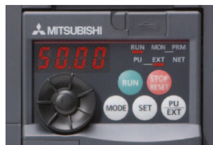
Встроенная панель управления с поворотным пультом управления

Помимо ввода и индикации различных параметров, встроенный четырехрядный жидкокристаллический дисплей используется также для контроля текущих эксплуатационных параметров и индикации сообщений сбоях и неисправностях.