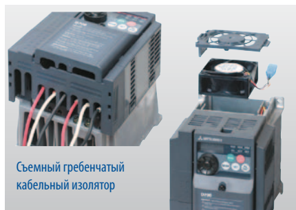
Съемный гребенчатый кабельный изолятор

Соответствие международным стандартам CE, UL, cUL, ГОСТ, RoHS гарантирует успешное применение по всему миру.