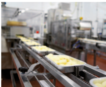
Ленточные и цепные конвейеры – идеальная область применения для FR-D700 SC.