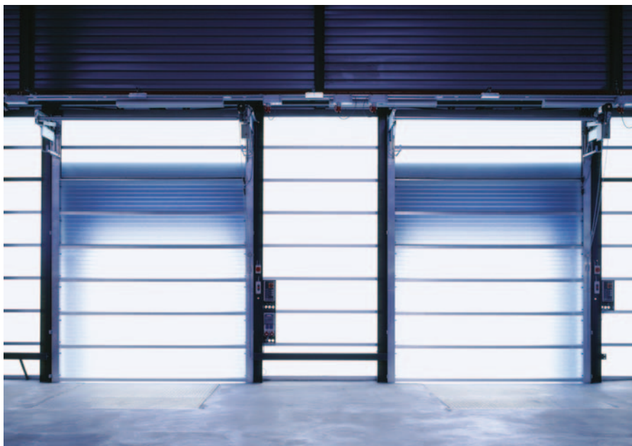
Приводы дверей и ворот – это лишь одна из многих областей применения преобразователей частоты новой серии FR-D700 SC.